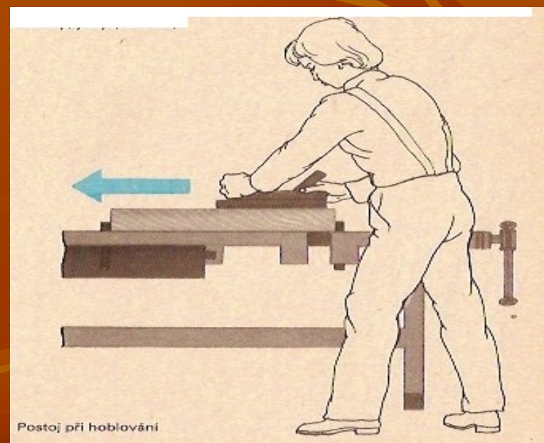
Postoj při hoblování

správné držení těla, hoblujeme celou horní polovinou těla